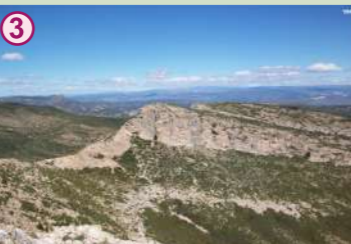
Vistas desde el pico de Santa María