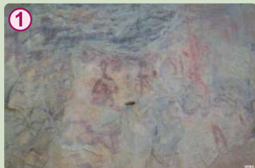
Arte rupestre en Bco. de las Clochas