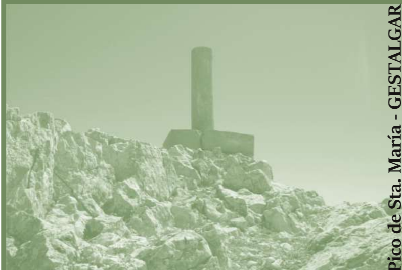
Ruta 8: Pico de Sta. María - GESTALGAR