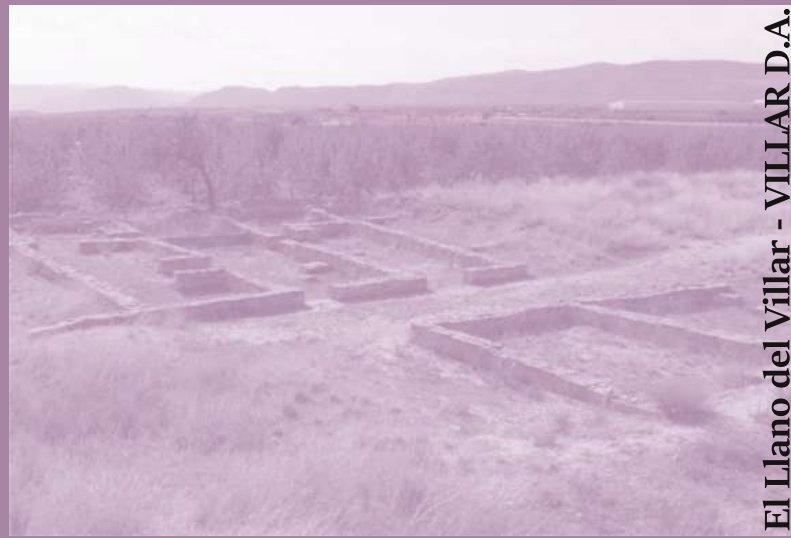
Ruta 6: El Llano del Villar - VILLAR D.A.