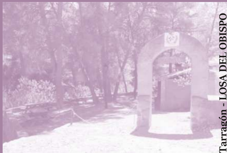
Ruta 5: Tarragón - LOSA DEL OBISPO