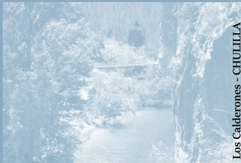
Ruta 3: Los Calderones - CHULLILLA