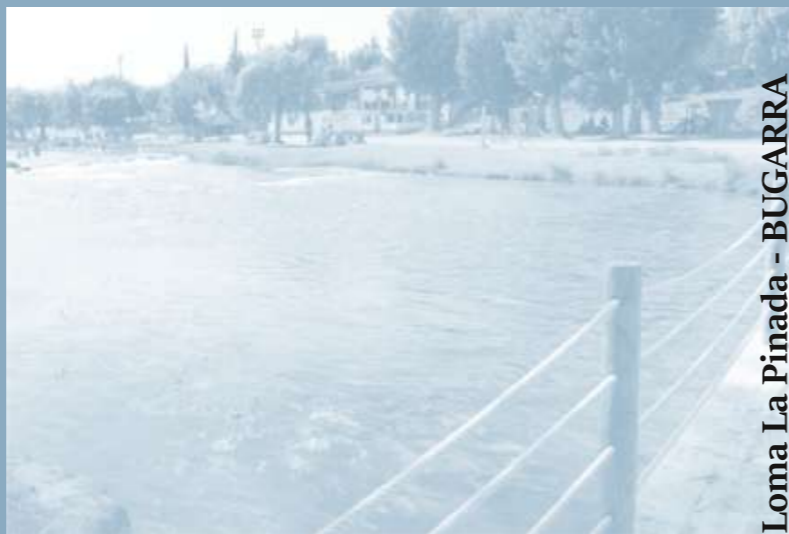
Ruta 2: Loma la Pinada - BUGARRA