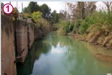
Densa vegetación del Palmeral