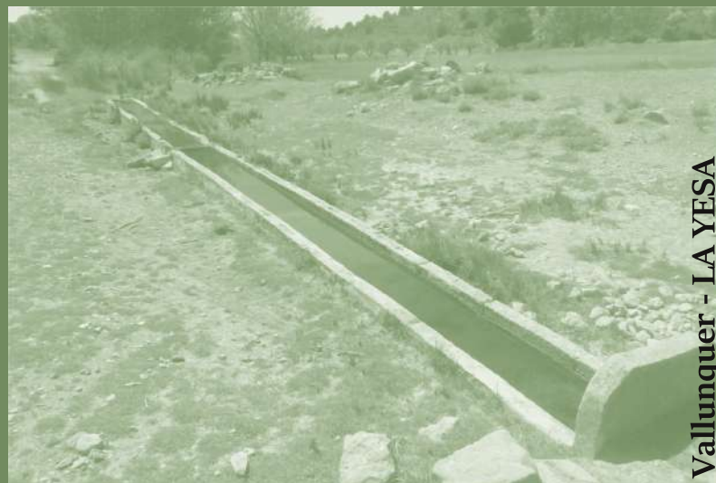
Ruta 12: Vallunquer - LA YESA