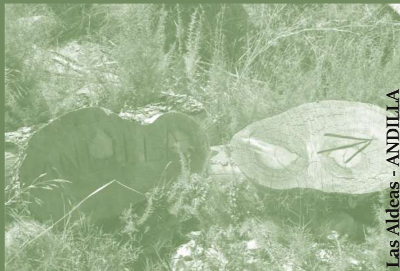
Ruta 11: Las Aldeas - ANDILLA